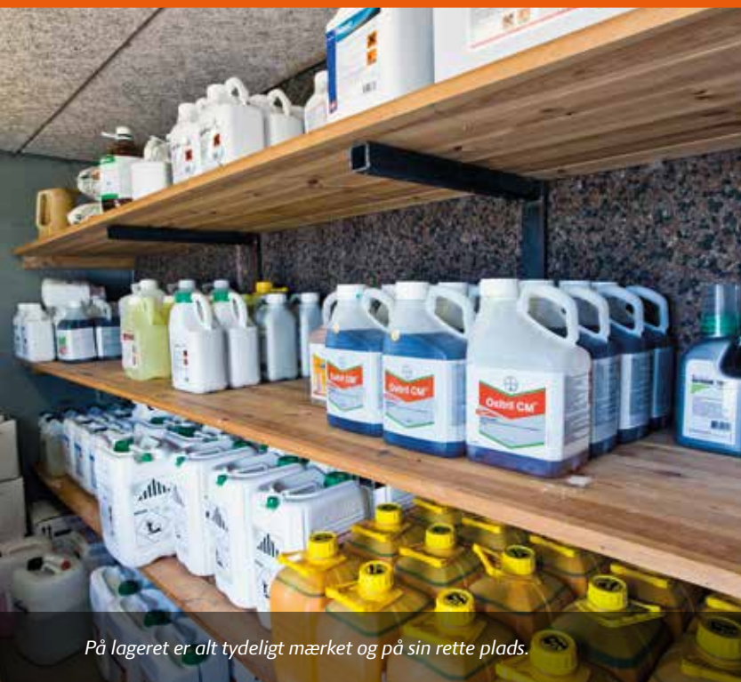
På lageret er alt tydeligt mærket og på sin rette plads.