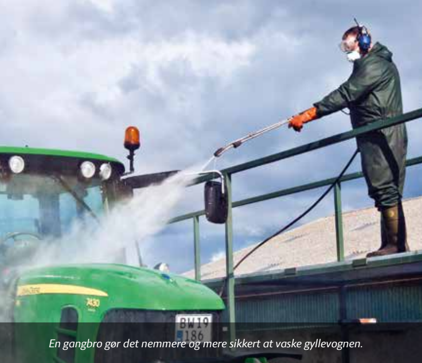
En gangbro gør det nemmere og mere sikkert at vaske gyllevognen.